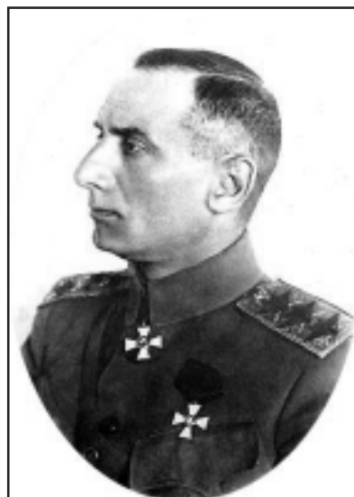
Александр Васильевич Колчак Портрет Верховного правителя России

1е – в фильме нет сюжета. Какие-то события, разумеется, встречаются, но, поскольку внутри рассказа они никак толком не выстроены – завязка, кульминация – то сводится к простому нанизыванию фактов. «Адмирал» невозможно пересказать: если попытаться вспомнить, что же в нем, собственно, происходит на протяжении двух часов, уткнешься все в ту же биографсправку – командовал, уехал, возглавил, был расстрелян. Ничего похожего на характер у Колчака за это время не вырисовывается. Играющий, или точнее изображающий, его Хабенский вообще за весь фильм ни разу не повышает голос, ни разу не проявляет эмоций.