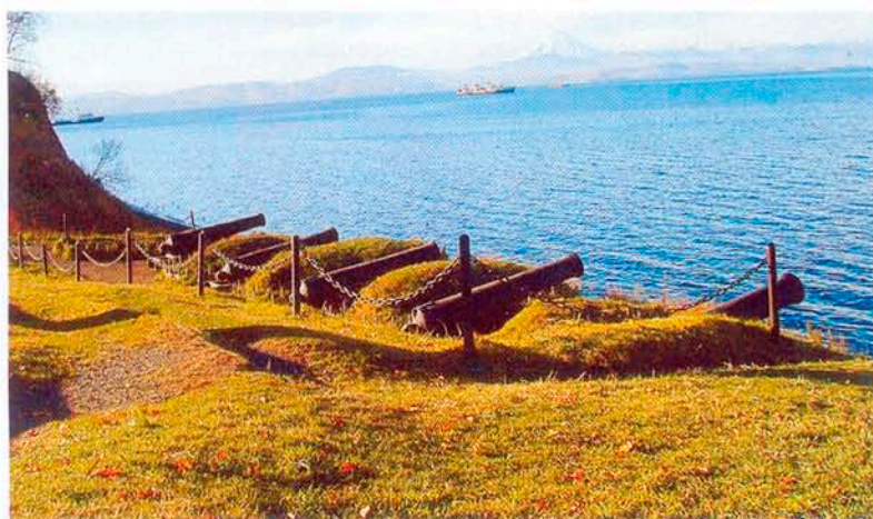
Реконструкция 3-й батареи, героически отражавшей напор противника в 1854 г.

Памятник же «переехал» на улицу Советская. Во второй половине 1970-х гг. памятник отреставрировали и перенесли еще на 10 – 15 м. На этом месте он и стоит по сей день.