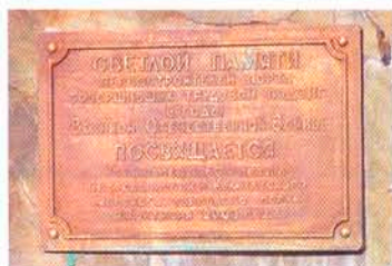
Памятный знак, посвящённый первым строителям Петропавловского порта

Одним из первых памятников, установленных на Дальнем Востоке, можно считать стелу, посвящённую основателю города – выдающемуся мореплавателю Витусу Берингу. Она была построена по инициативе экипажей кораблей «Открытие» и «Благонамеренный», прибывших в порт в 1821 г., и начальника Камчатки П.И. Рикорда примерно